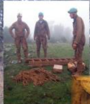
Seance de topographie Aven du Metro