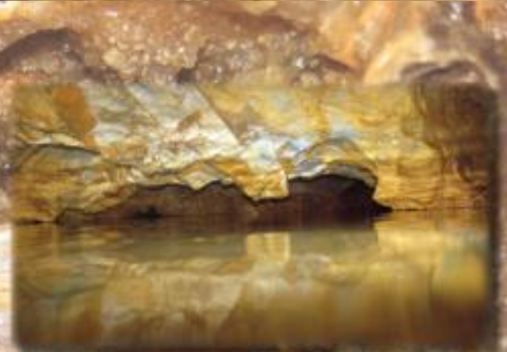
Le siphon N°4