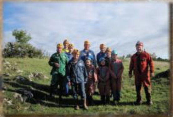
Calet - Septembre