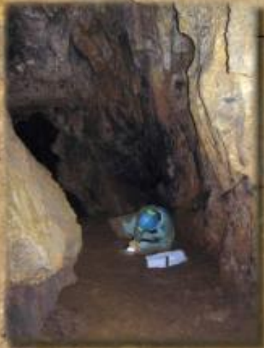
Topographie détaillée des traces laissées par les mineurs