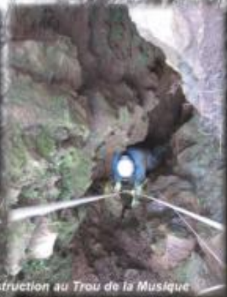
Desobstruction au Trou de la Musique