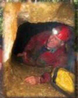
Perçes à Plolyphème Avril 2013