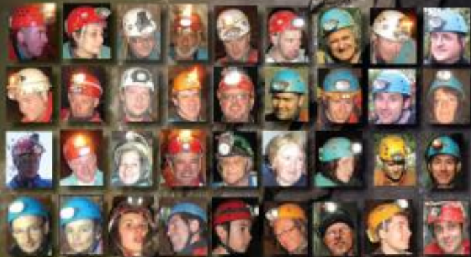
Photo de couverture - La colonne du Cailé - Tarn Directeur de publication : Jean-Charles Pétronio Impression : Corep Toulouse - France

A tous un grand merci pour les résultats obtenus. Les perspectives d'exploration sont prometteuses pour 2014, bientôt peut-être un Cailé N°2 !!!