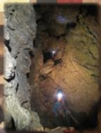
l'Aven Viala - Juin 2013