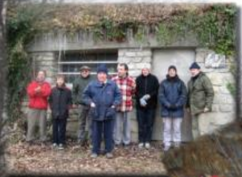
Ariège Visite du laboratoire souterrain de Moulis et de la grotte. Février 2013