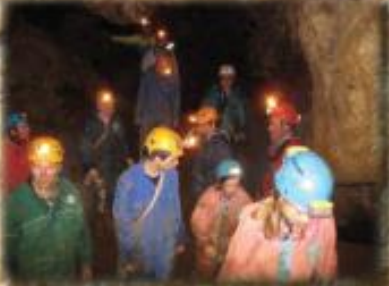
Sortie découverte au Calet