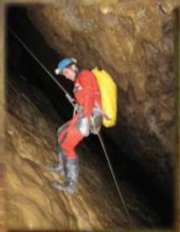
Grotte de la Trayolle - Colmiou - Herault Avril 2013