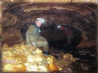
Siphon N° 2 du Calet (vue amont)