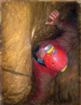
Chaudière entre Polyphème et le Calet