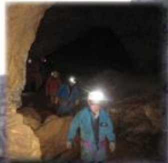
Sortie découverte archéologique au Calel