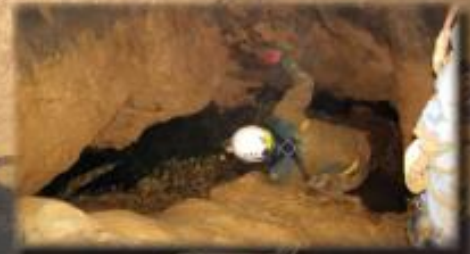
le siphon amont