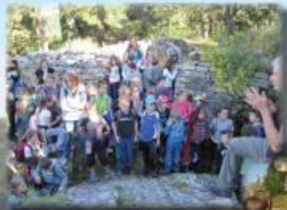
Journée pédagogique des écoles Berniquaut - Octobre 2013 -