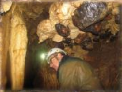
Les conglomérats en suspension dans Polyphème