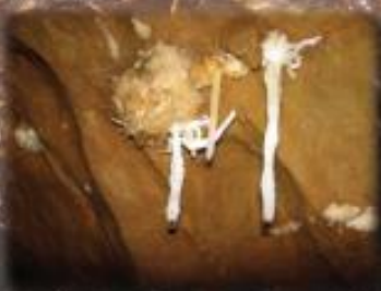
Excentriques au départ du réseau de la vierge