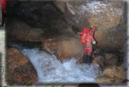
Le Mas Raynal