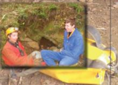
Rampage dans les voutes basses