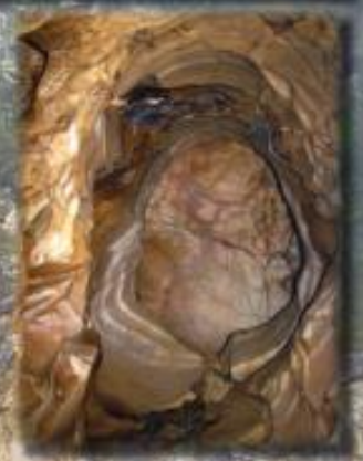
Résurgence de Fendelle - Octobre 2013 -