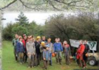
Causse de Soréze