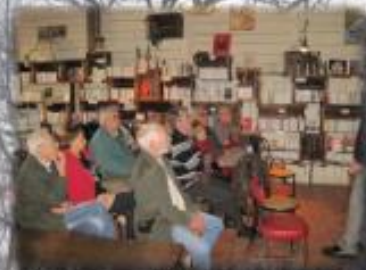
Conférence à Lautrec Tarn Site minier médiéval de la grotte avec du Métré. Mars 2013