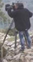
Equipe FR3 dans la grotte du Calel