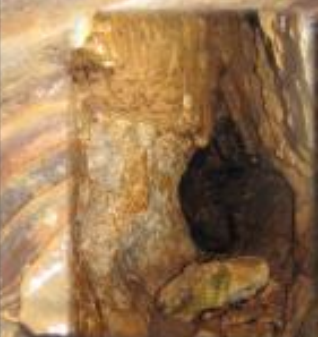
Ancienne porte de Polyphème dans le vallon