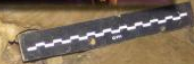
Empilement de pierres en banquettes pour faciliter le passage