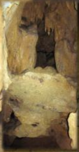
Relevés de traces archéologiques dans la grotte du Calel