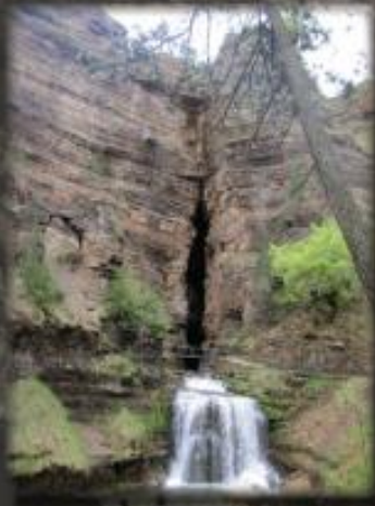
Aven de Bramabiau