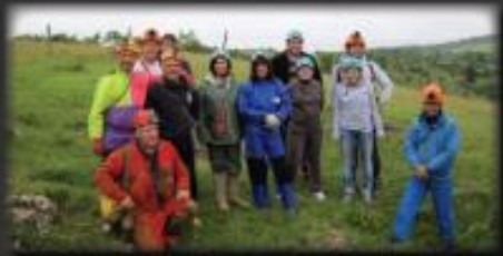
Découverte de la spéléo - Grotte du Cafei Juin 2013