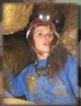
Camp EDS grotte des Barthasses