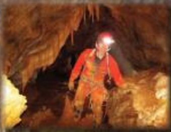
Mine du Pouech d'Unjat - Cadarzac, Ariège Mai 2013