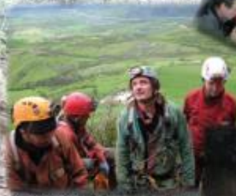
Grotte de Sèze