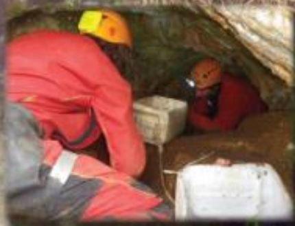
Désobstruction à Berniquaut Trou de la RATP Mars 2013