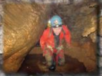
Rivière et Réseau Capdeville