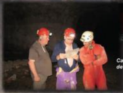
Carrières souterraines de chaux de Bauzeles Juillet 2013