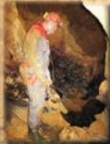
l'arrivée dans la rivière