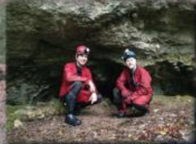
Rivière de Las Fonts