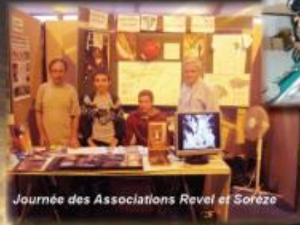
Journée des Associations Revel et Soreze