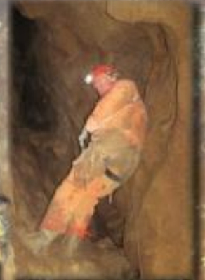
Cadarcet - Ariège