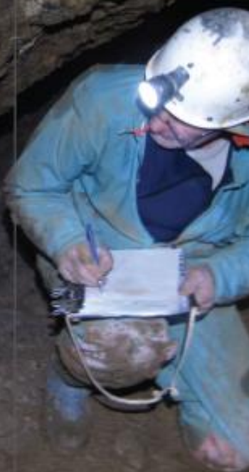
Relevés archéologiques - Grotte du Cailé Février - Juin 2013