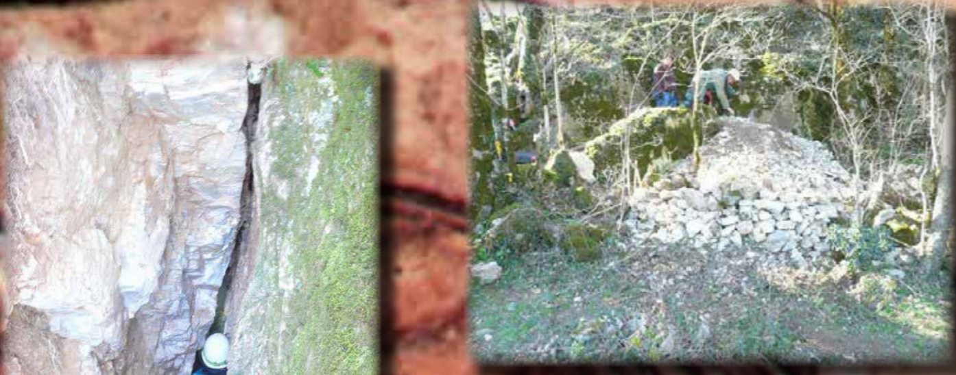
GROTTE DE LA TRAYOLLE