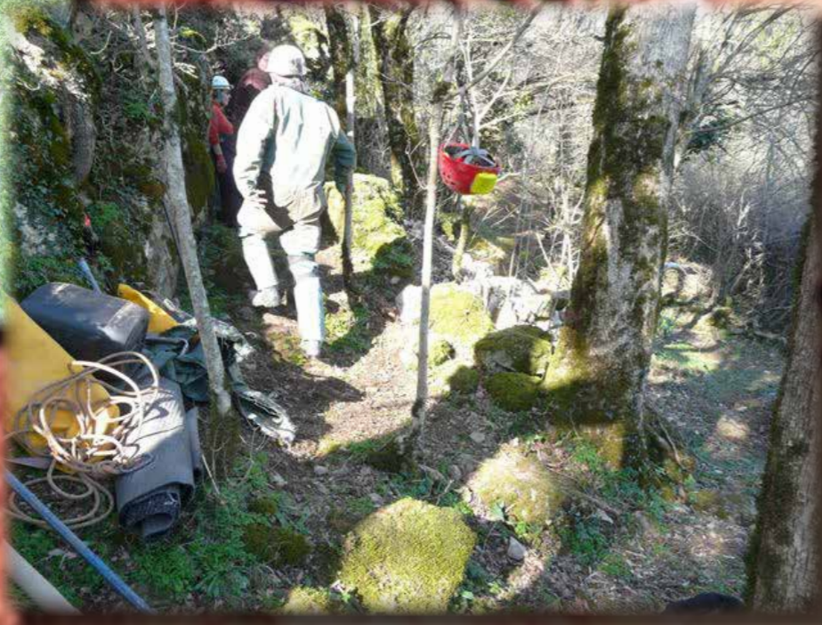
DESOBSTRUCTION AU GOUPIL