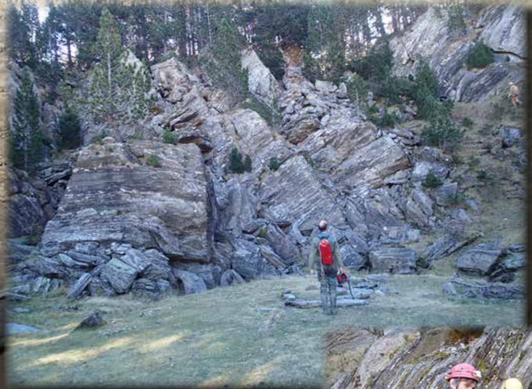
GOUFFRE DU MOUNEGOU