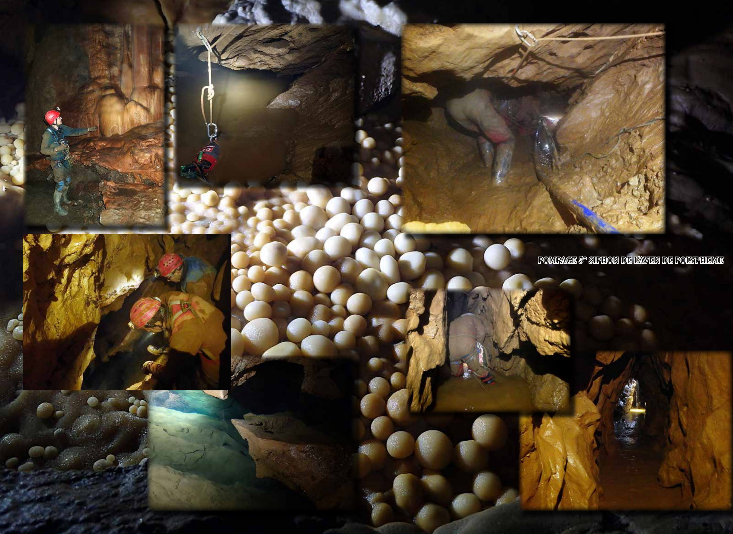
POMPAGE 5° SIPHON DE L'AVEN DE POLYPHEME