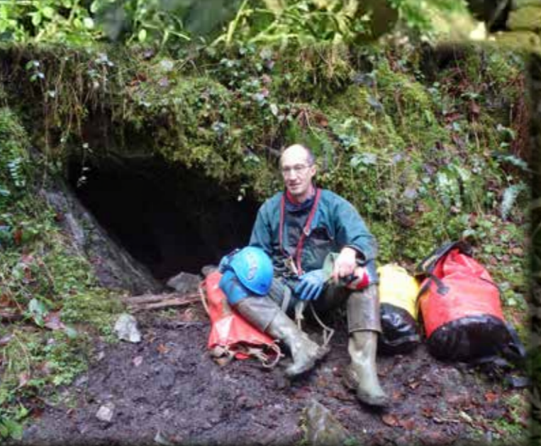
ENTRAINEMENT A FENDEILLE