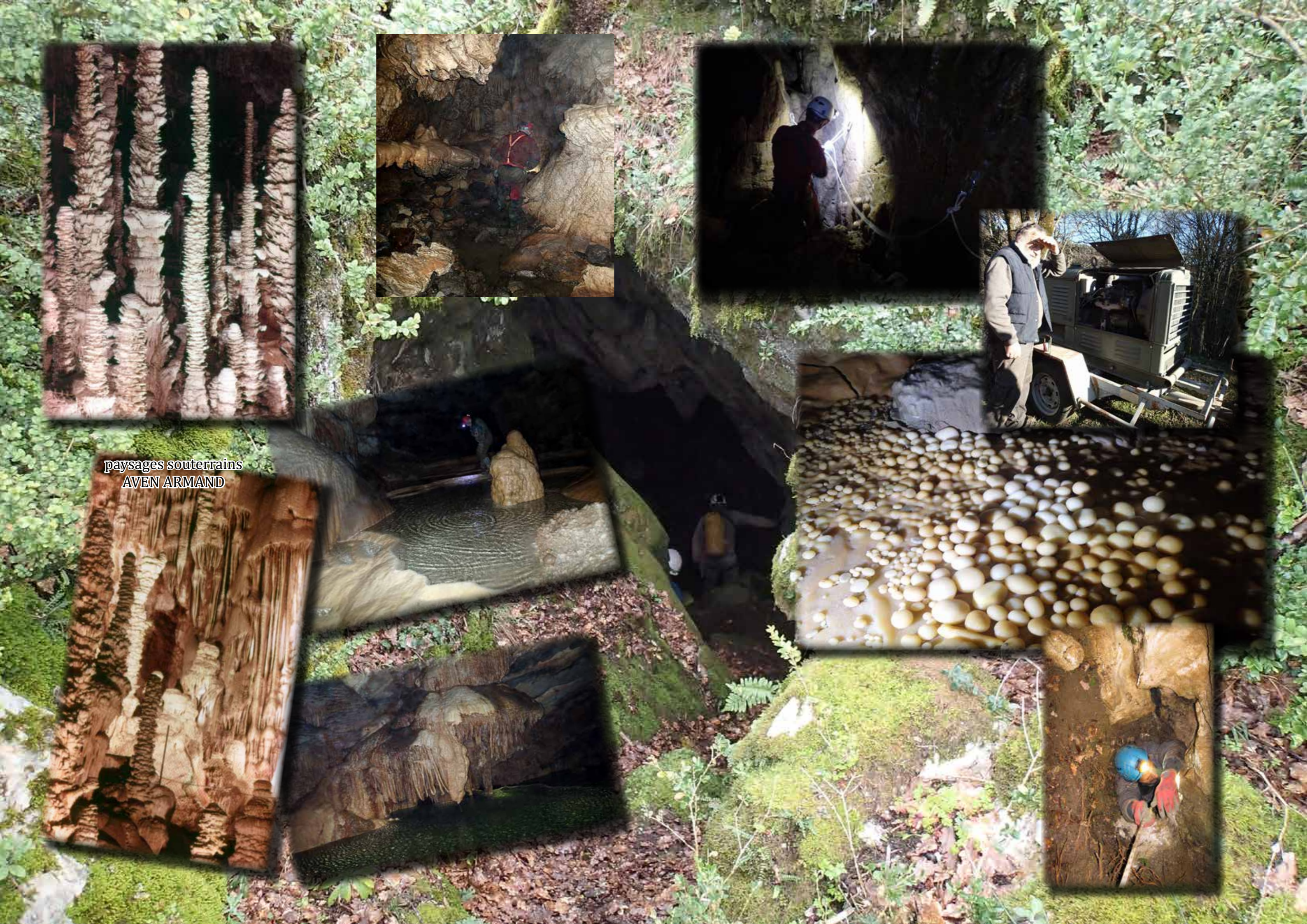
paysages souterrains AVEN ARMAND