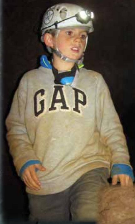
GROTTE DE SAINT-JAMMES (OURS)