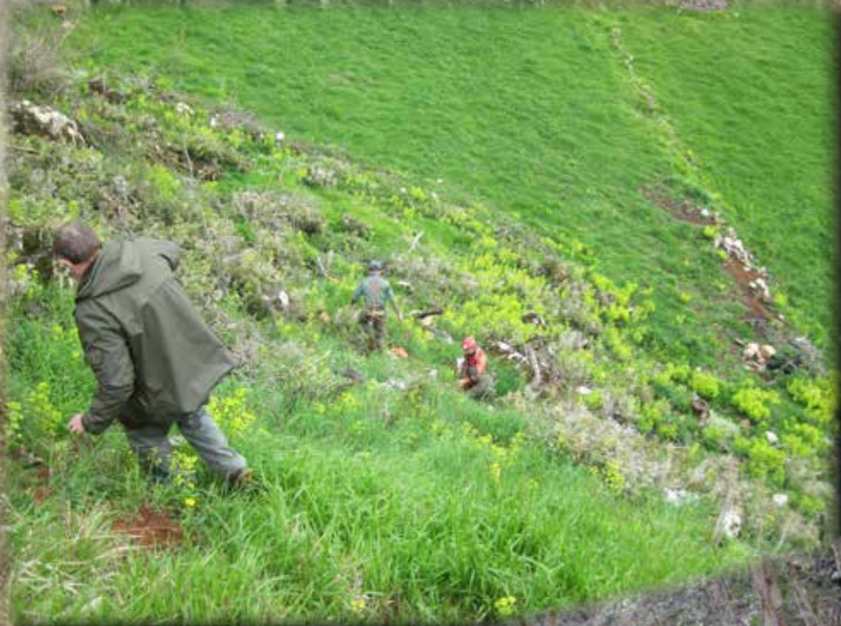
PROSPECTION DE SURFACE