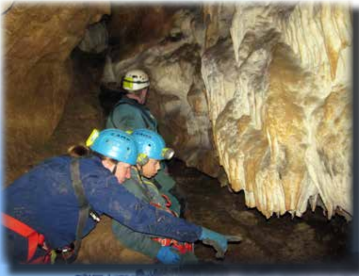
GROTTE BERNARD (ARIEGE)