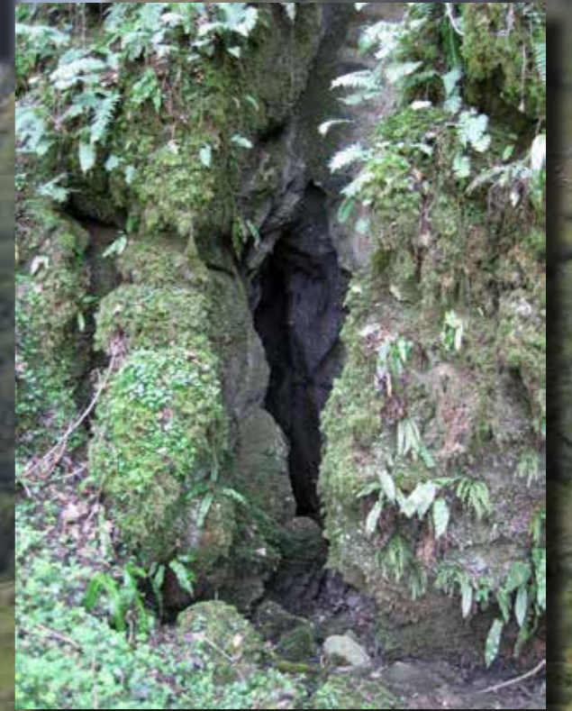
PROSPECTION SUR CADARCET