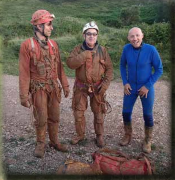
MINE DU PUECH