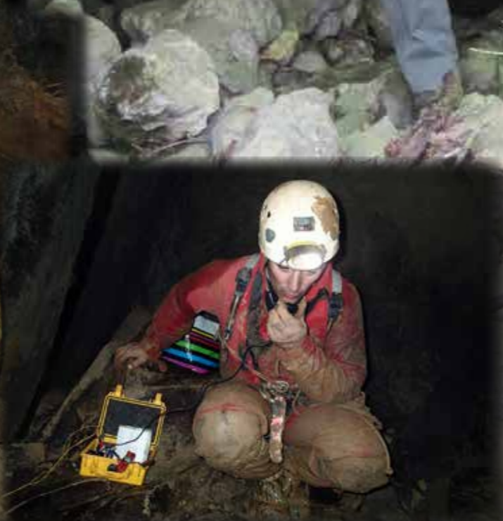
POMPAGE DU SIPHON DU GOUFFRE DE CADARCET ET TOPOGRAPHIE