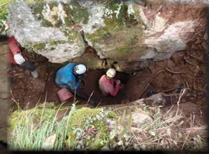
DESOBSTRUCTION AU R100