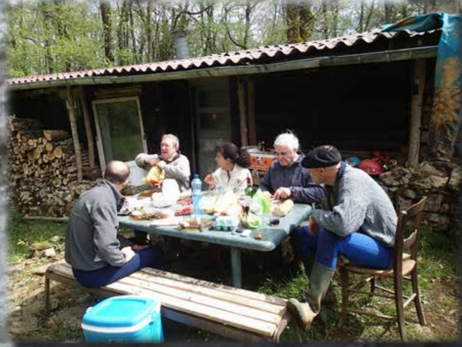
CADARCET ET GALERIE ROUGH