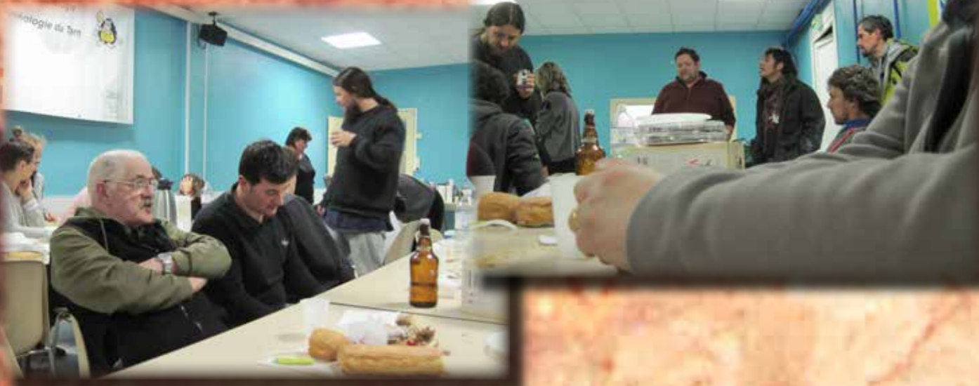
ASSEMBLEE GENERALE C.D.S.81