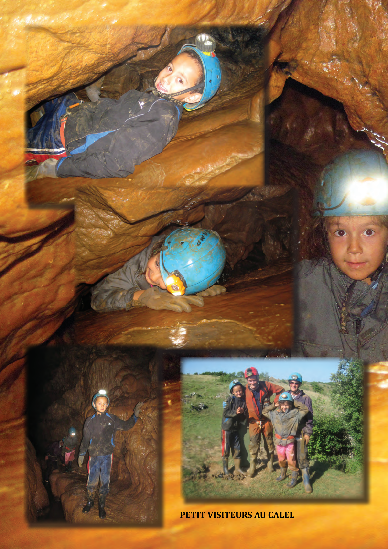
PETIT VISITEURS AU CALEL