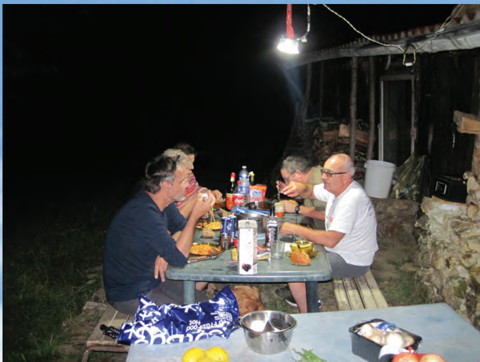
CADARCET SOIRÉE DÉTENTE