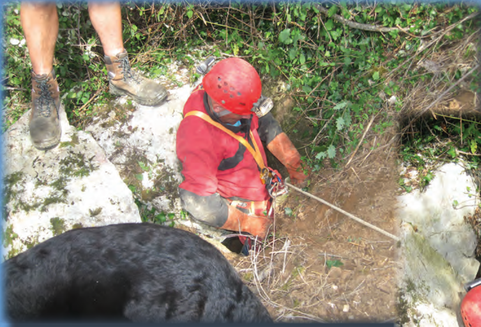
AVEN DE L'ANTENNE PUECH D'UNJAT - 09