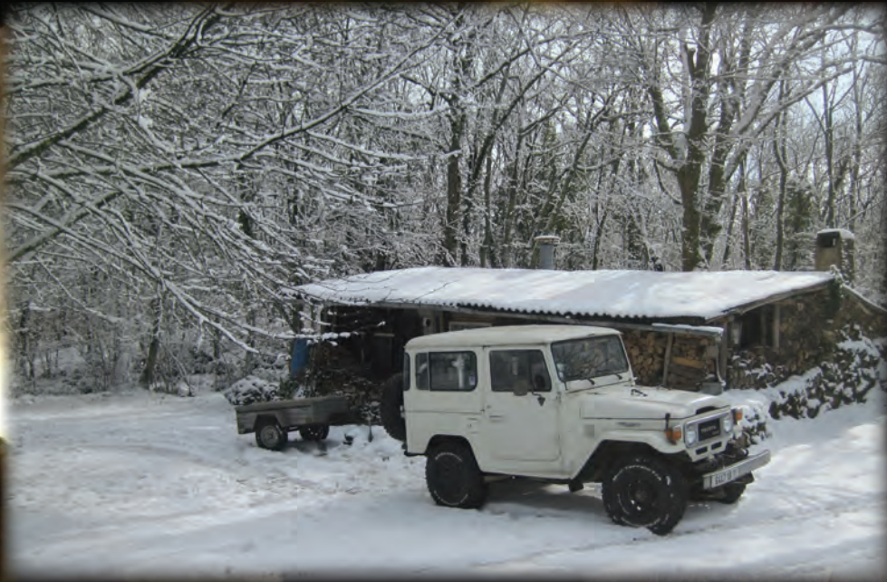
CADARCET EN HIVER