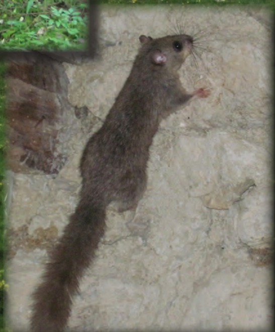
NOS LOCATAIRES EN ARIÈGE