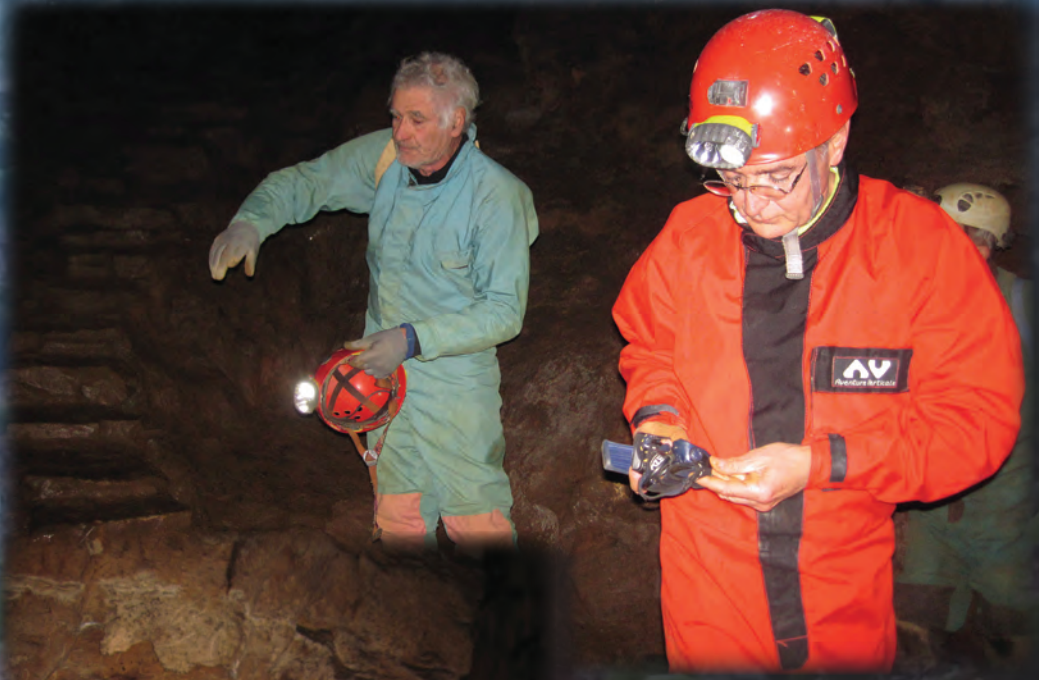
GUIDAGE D'ARCHÉOLOGUES AU CALEL