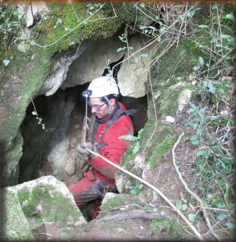
DÉPOLLUTION DU GOUFFRE DE CADARCET