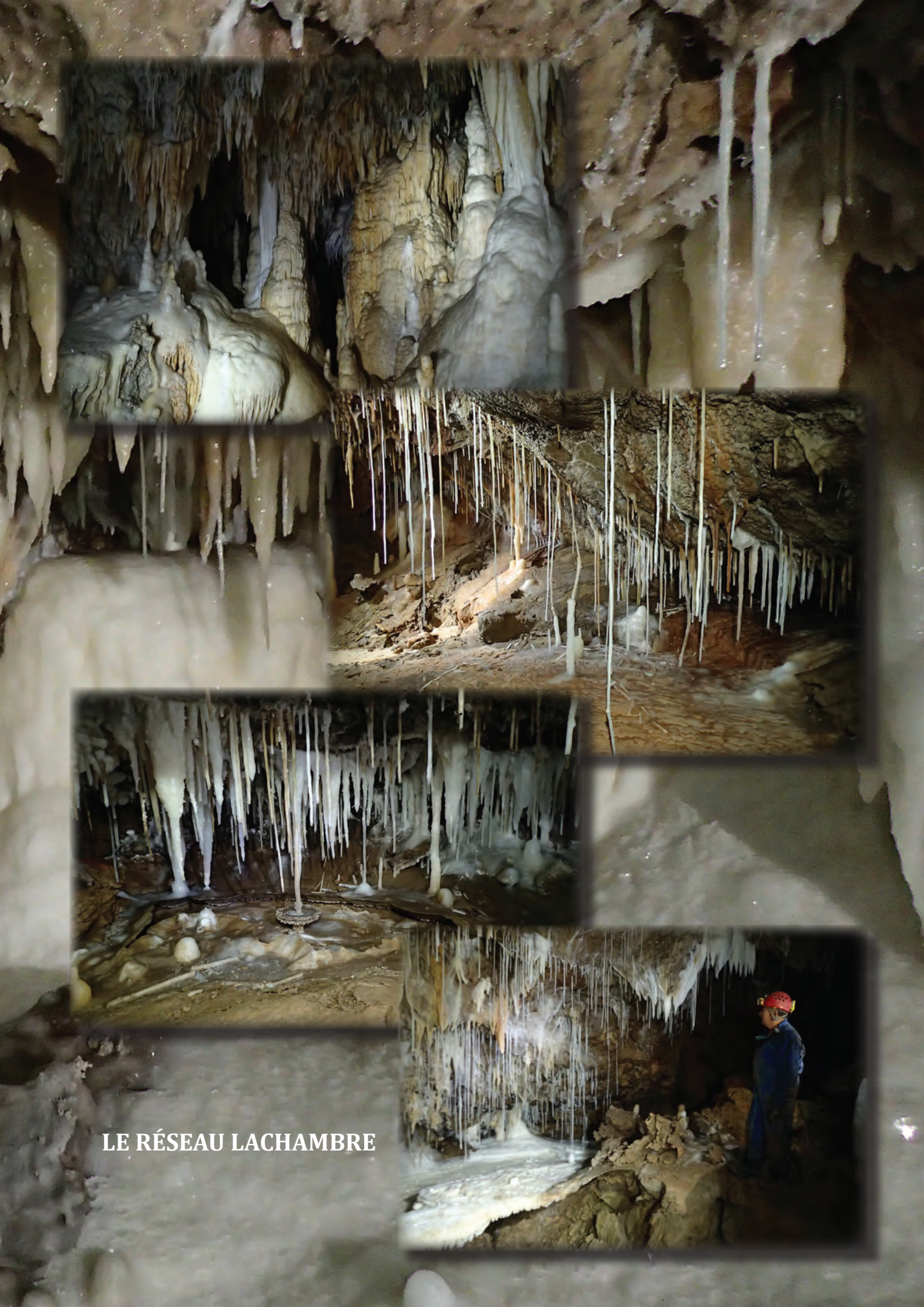
LE RÉSEAU LACHAMBRE