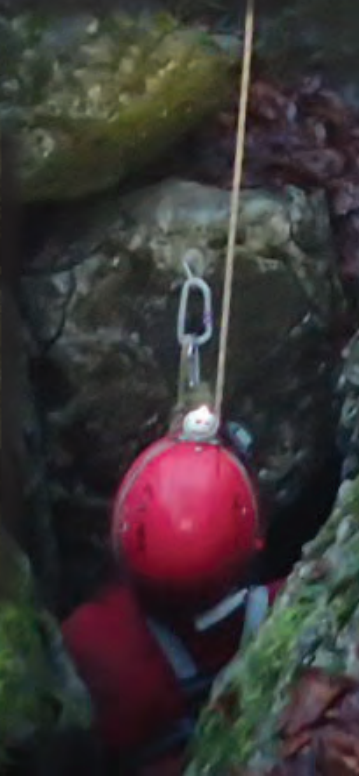
LE TROU MILE ARBAS - 31