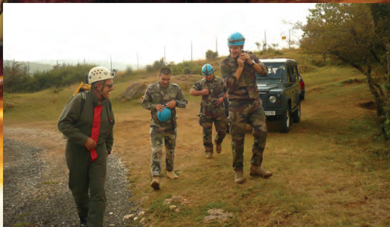
LA LÉGION AU CAEL