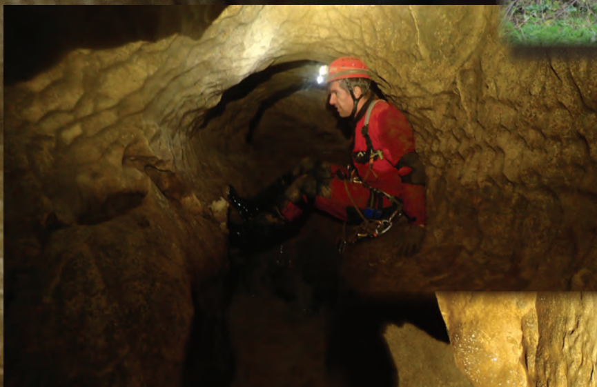
GOUFFRE DES MATETS