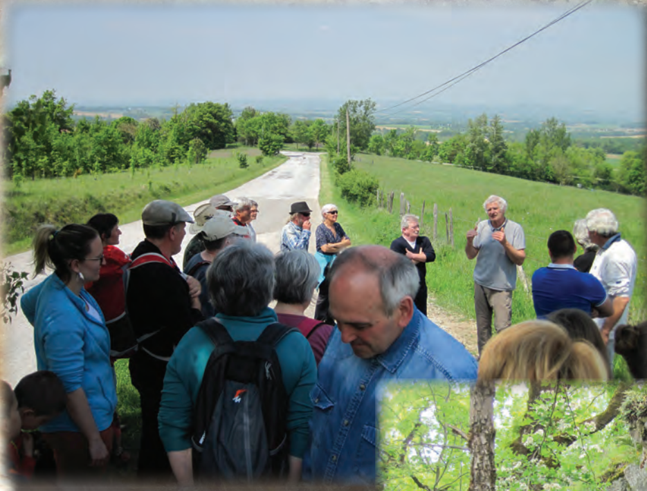
GUIDAGE À ST-AMANCET