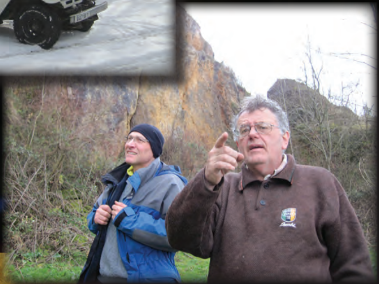
PROSPECTION VERS LA GAROSSE