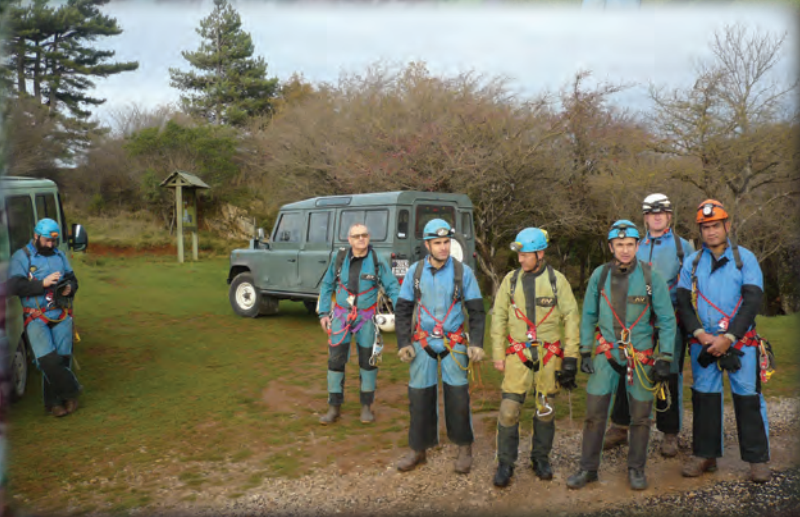
LA LÉGION AU CALEL