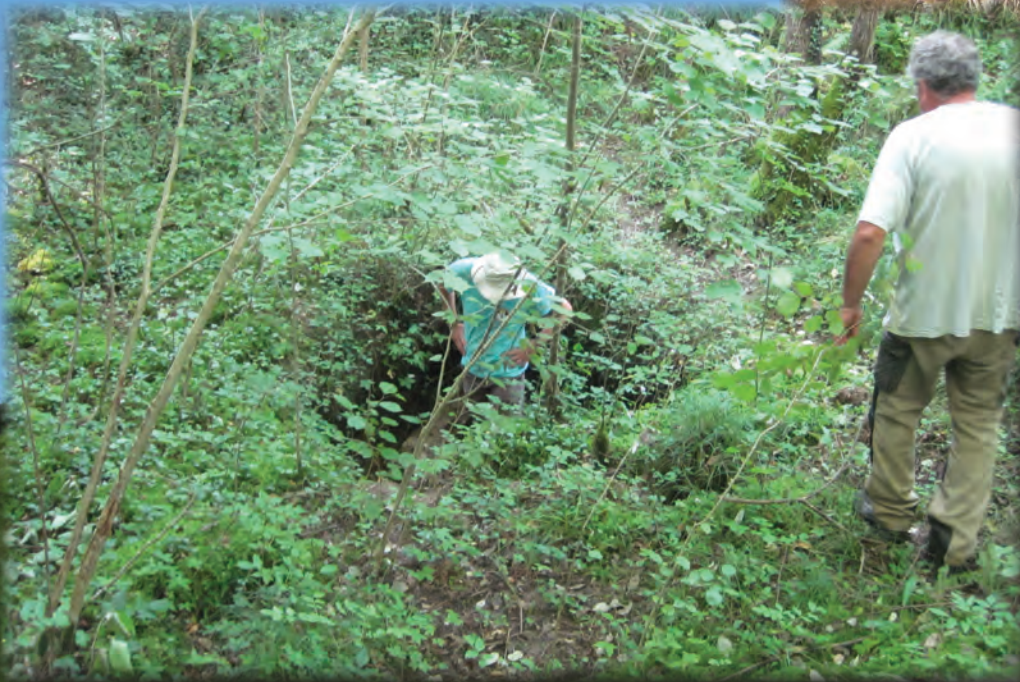
PROSPECTION À CADARCET